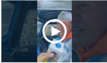
#Ibagué | Desfile de carros camperos a esta hora sobre la Quinta