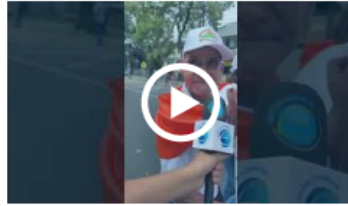
Así va el desfile de Jeeps y la carrera campesina con botas en #Ibagué