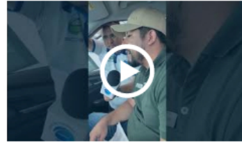
¡ No te pierdas el KIA Fan Experience en el Centro Comercial Acqua del 11 de junio al 19 de Julio