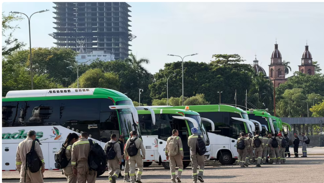
Postal de los trabajadores de Ecopetrol en Meta.

Una segunda jornada de la mesa tripartita convocada por el Ministerio de Trabajo, con participación de la subdirectiva del Meta, de la Unión Sindical Obrera, y las empresas del sector petrolero, concluyó este viernes sin que se lograra un acuerdo en el conflicto laboral.