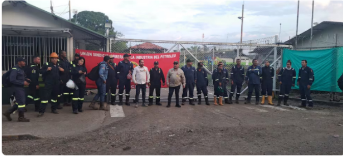
Unión Sindical Obrera-USO, de trabajadores de Ecopetrol, en paro de 24 horas, por dificultad para negociar el pliego de peticiones.

Según el gremio Campetrol, que representa a algunas empresas que operan en la zona, en vez de canales de diálogo técnico, jurídico e institucional , se han utilizado bloqueos y ya en el Meta han sido afectados 16 equipos de taladro y alrededor de 1.120 trabajadores.