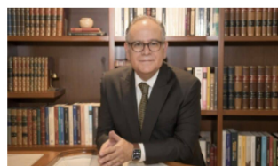
Entrevista | Cerca de 12 millones