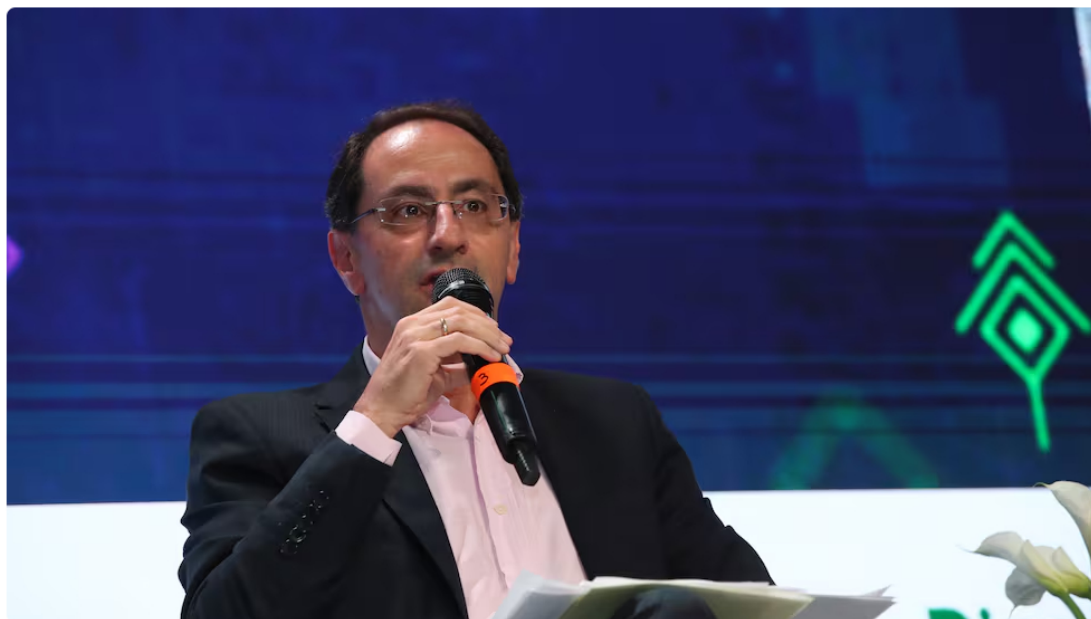
José Manuel Restrepo.

José Manuel Restrepo lanzó fuertes cuestionamientos sobre la situación de Ecopetrol y sobre las decisiones adoptadas por el Gobierno nacional en materia energética.