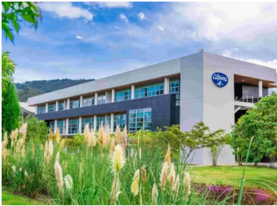
Alpina estuvo entre las empresas mejor puntuadas.

El informe también entregó las empresas mejor calificadas según su sector productivo. En el segmento agroindustrial, la empresa más deseada es el Grupo Bios , seguido por el Grupo Manuelita y por Ingenio Providencia. En el área de alimentos resultaron como empresas más apetecidas Alpina, Nestlé y Colombina , al tiempo que entre las empresas de bebidas fueron Bavaria, Postobón y Coca Cola las mejor calificadas.