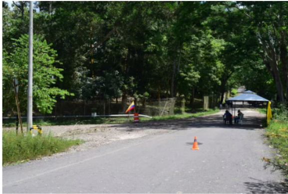
La comunidad de Sabana de Torres mantiene bloqueos en inmediaciones del Campo Provincia, donde reclama claridad sobre el futuro de una campaña de workover socializada semanas atrás.

Los manifestantes aseguran que durante esos encuentros se informó sobre la llegada de la empresa Braserv para desarrollar los trabajos y que se abrirían oportunidades laborales para nuevos profesionales y trabajadores de la zona. Incluso, afirman que se adelantaron procesos relacionados con la contratación de personal.