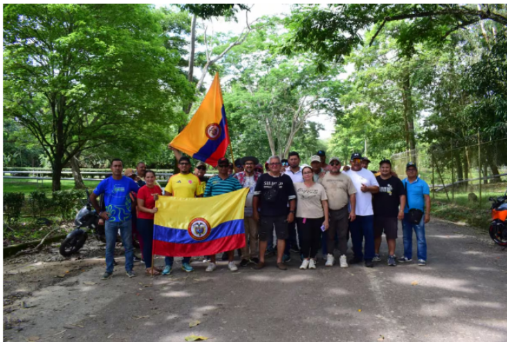
La comunidad de Sabana de Torres mantiene bloqueos en inmediaciones del Campo Provincia, donde reclama claridad sobre el futuro de una campaña de workover socializada semanas atrás.