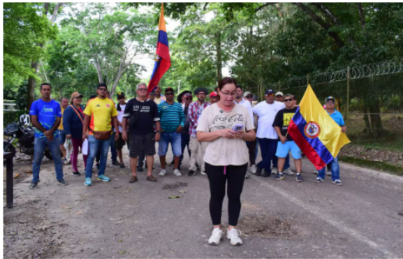
La comunidad de Sabana de Torres mantiene bloqueos en inmediaciones del Campo Provincia, donde reclama claridad sobre el futuro de una campaña de workover socializada semanas atrás.

“Ecopetrol advierte que esta situación genera una vulneración directa a los derechos fundamentales y pone en riesgo el suministro de gas domiciliario para la comunidad de la región debido a que el personal operativo se encuentra encerrado en las instalaciones, ya que los manifestantes impiden los cambios de turno reglamentarios”, señaló la compañía en el comunicado.