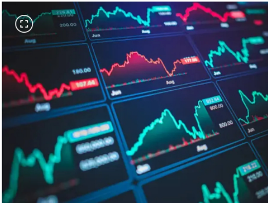
El país se mueve a un ritmo económico modesto y en medio de grandes presiones.

Estos datos muestran que hubo un mayor interés por operar acciones en la Bolsa colombiana, incluso cuando los resultados generales del mercado no reflejaron ganancias importantes en los índices.