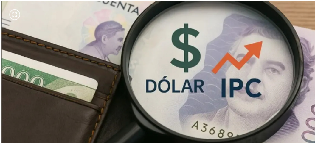
El país se mueve a un ritmo económico modesto y en medio de grandes presiones.

Acciones de empresas colombianas se mantienen al alza dos días después de la primera vuelta