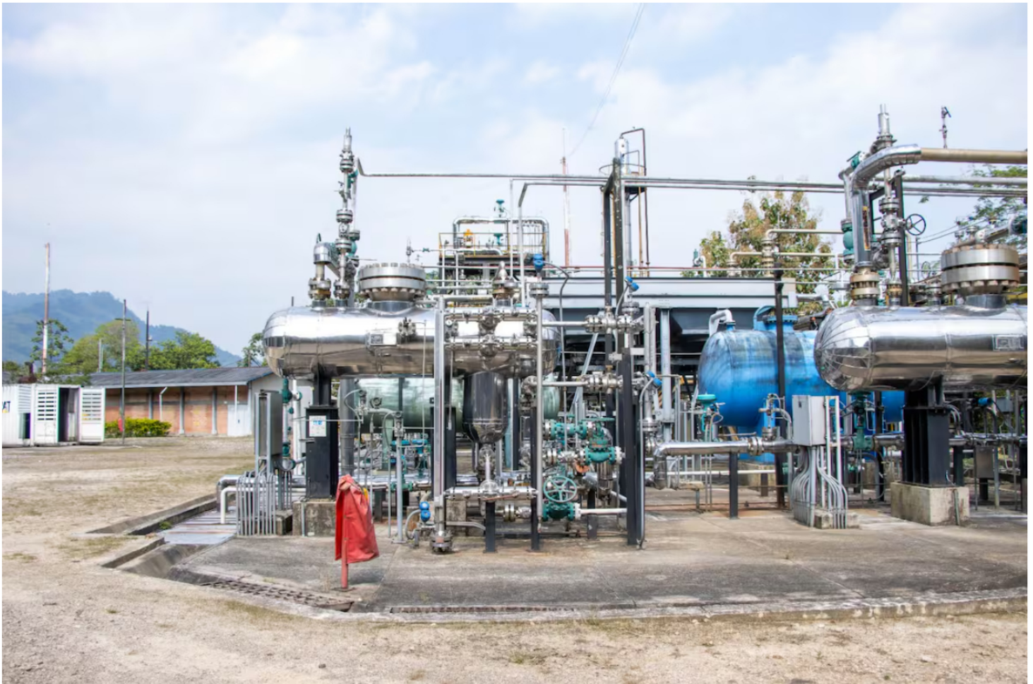
Denuncian millonarios contratos en Ecopetrol en ley de garantías.

Redacción Colombia 02 JUN 2026 - 09:21 PM