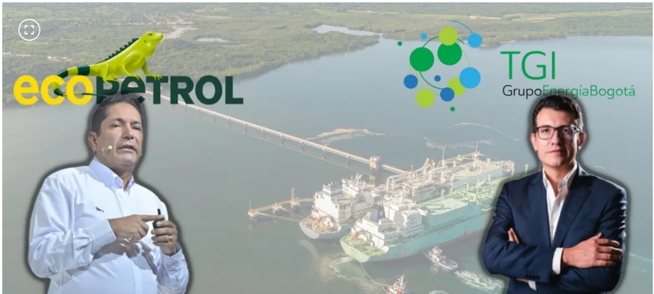
Ecopetrol - TGI

Los bloqueos por permisos cruzados postergaron los cronogramas que ambas empresas prometían para inicios del próximo año.