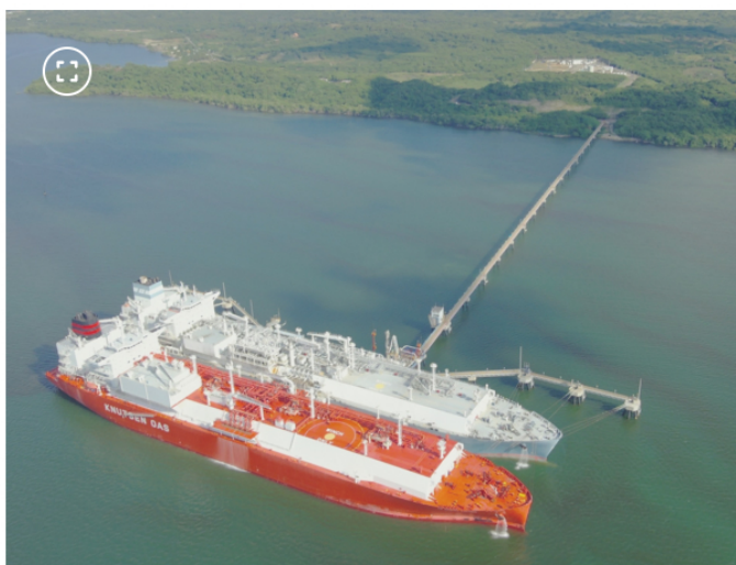
Regasificadora de Cartagena

Al final, ni la regasificadora de Ecopetrol ni la de TGI no estarán listas a comienzos del próximo año como se prometió inicialmente para enfrentar la época más crítica del fenómeno de El Niño , luego de una serie de cuestionamientos mutuos sobre su factibilidad técnica.