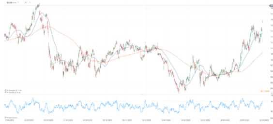
Gráfico de las acciones de Ecopetrol (EC.US).

dólares, el mayor avance de cualquier índice en el mundo esa jornada. El peso colombiano (USDCOP) se apreció 3.6% frente al dólar, su mejor día desde mayo de 2022, y los bonos soberanos con vencimiento en 2054 avanzaron más de cuatro centavos hasta los 112 centavos por dólar. En la bolsa local, la preferencial de Grupo Aval lideró con una subida de 9.62%, seguida por la preferencial de Davivienda con 5.81% y el Banco de Bogotá con 5.69%.