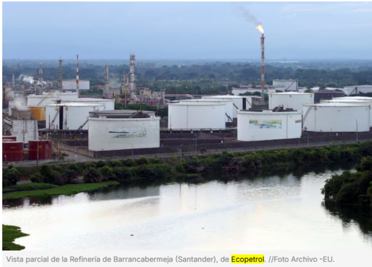
Vista parcial de la Refinería de Barrancabermeja (Santander), de Ecopetrol .

Compartir Publicado por: Redacción Vanguardia