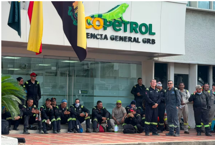
Durante la jornada de paro de 24 horas en el país se registraron bloqueos al interior de la Refinería de Barrancabermeja.

Compartir Publicado por: Lesly Adriana Cifuentes