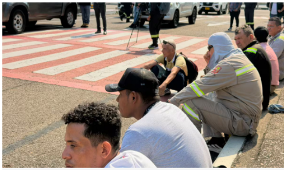
Durante la jornada de paro de 24 horas en el país se registraron bloqueos al interior de la Refinería de Barrancabermeja.