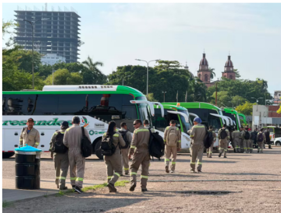
Durante la jornada de paro de 24 horas en el país se registraron bloqueos al interior de la Refinería de Barrancabermeja.

“La Empresa rechaza las afirmaciones de la USO relacionadas con el proceso de negociación y reitera su disposición permanente al diálogo constructivo que permita avanzar en la búsqueda de acuerdos sostenibles durante la etapa de arreglo directo, la cual permanece activa mediante conversaciones fundamentadas en el respeto, la escucha y la construcción conjunta, en beneficio de las personas trabajadoras, sus familias y el país”, expresó la compañía.