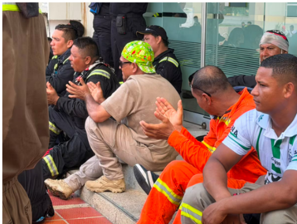
Durante la jornada de paro de 24 horas en el país se registraron bloqueos al interior de la Refinería de Barrancabermeja.

La empresa sostuvo, además, que la negociación permanece activa y que existe disposición para continuar buscando consensos que permitan alcanzar acuerdos sostenibles para las partes.