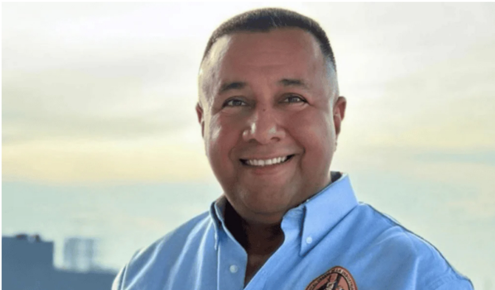
El presidente de la USO, Martín Ravelo.

De acuerdo con la organización sindical, el objetivo de las negociaciones es lograr mejoras salariales y fortalecer las condiciones laborales tanto de los trabajadores directos como de los contratistas.