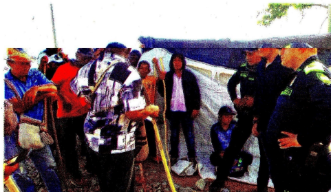
Diálogo entre autoridades y manifestantes en Albano, La Guajira.

La compañía enfatizó que la seguridad se mantiene como su principal directriz corporativa, razón por la cual cada etapa de la reactivación se desarrollará garantizando las condiciones necesarias para proteger a las personas, el medio ambiente y la infraestructura. El plan de reapertura se puso en marcha inmediatamente después de que se despejara la vía férrea, lo que permitió comenzar el