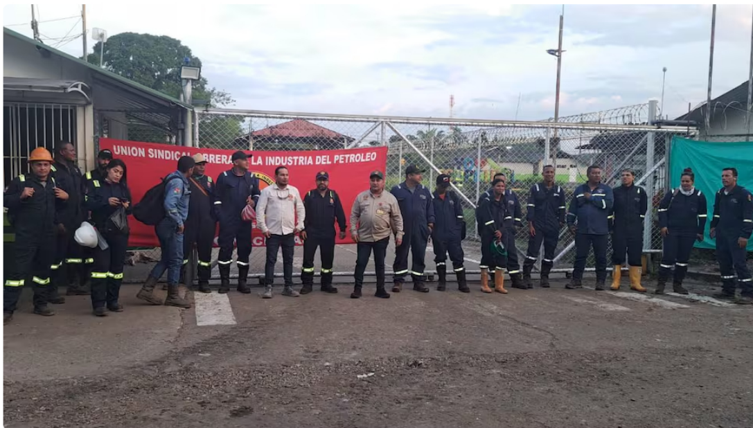
Unión Sindical Obrera-USO, de trabajadores de Ecopetrol , en paro de 24 horas, por dificultad para negociar el pliego de peticiones.