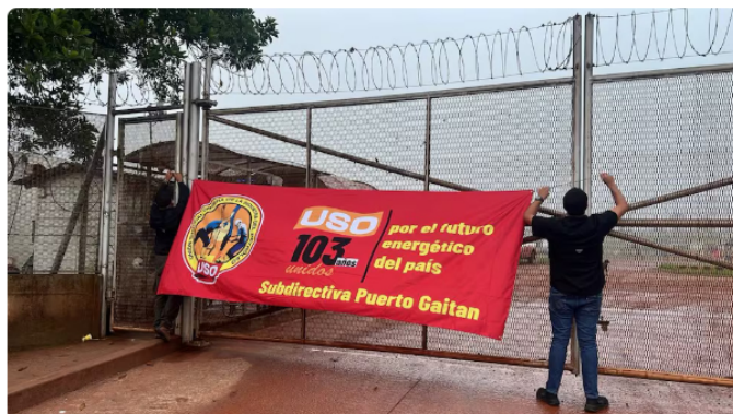
Paro de la USO, por no avance de la negociación colectiva

Hemos evidenciado que después de la salida de Roa el impacto (negativo) reputacional de Ecopetrol ha venido disminuyendo. Necesitamos garantizar financieramente que nuestra empresa se mantenga estable para que vuelva a recuperar los estándares productivos del pasado.