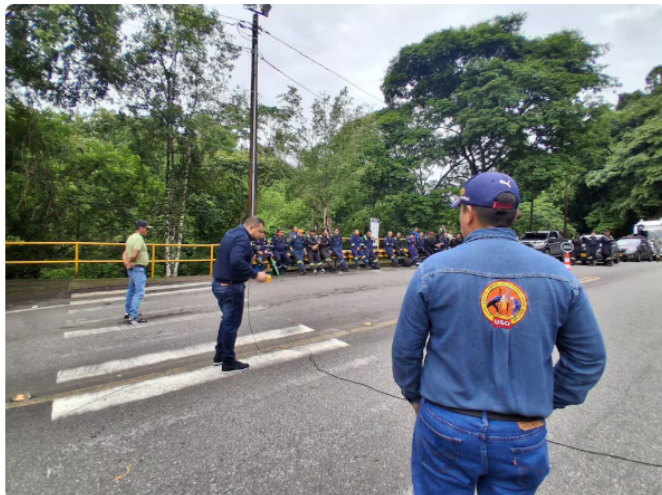
Paro de la USO, por falta de acuerdo en el pliego de peticiones.

M.R.: Totalmente. Es más, en el pliego de peticiones incluimos la necesidad de desarrollar los pilotos experimentales de yacimientos no convencionales a través de la técnica del fracking que ya están autorizados.