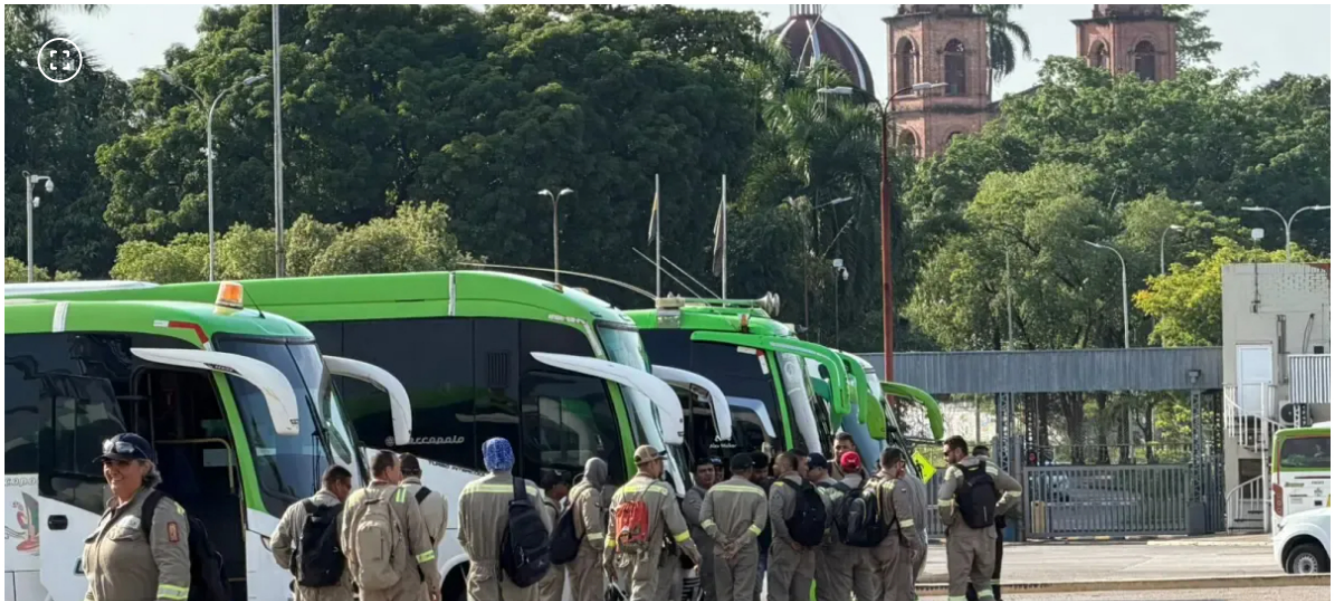
Los trabajadores de la USO piden acciones urgentes para superar el paro.

La USO anunció que no votará por Iván Cepeda y pidió mantener exploración petrolera