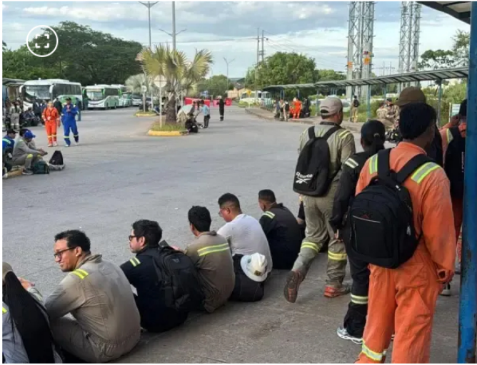
Los trabajadores de la USO piden acciones urgentes para superar el paro.

Según la USO, el eje central del pliego es proteger el futuro de la industria petrolera , garantizar la soberanía energética de la nación y asegurar una transición energética “justa, social y sostenible” para las regiones. La organización también afirmó que busca el mejoramiento de los salarios y el fortalecimiento real de los derechos laborales de los trabajadores directos y de las firmas contratistas.