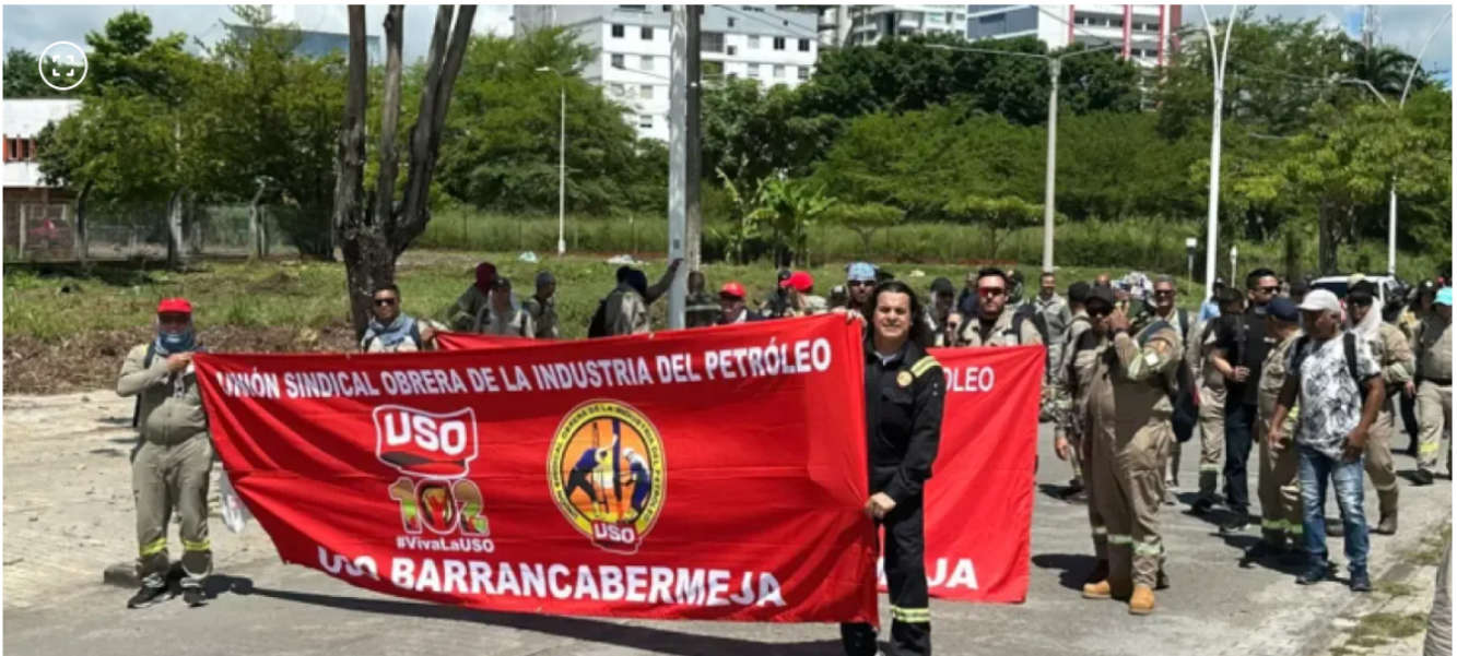
Manifestaciones de la USO

Las solicitudes incluyen estabilidad laboral, aumentos salariales y beneficios de salud para pensionados.