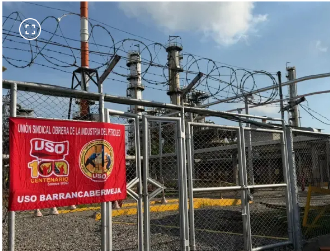
Los trabajadores de la USO piden acciones urgentes para superar el paro.

En el frente de cargos, la USO pide implementar un mapa de cargos para profesionales, identificado como MCP. También solicita aumentar los incrementos salariales actuales de operadores, técnicos y supervisores mediante el mapa de cargos MCO.