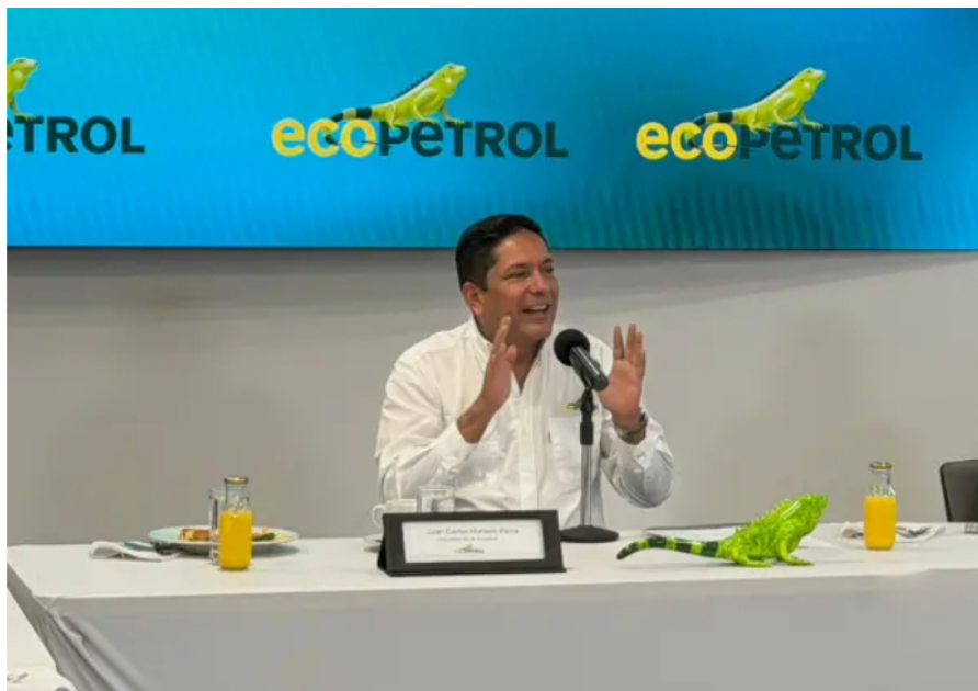
Juan Carlos Hurtado, presidente de Ecopetrol