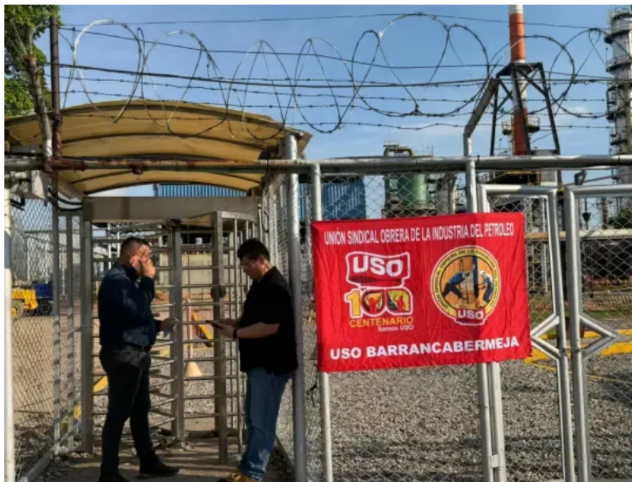
Los trabajadores de la USO piden acciones urgentes para superar el paro.

El dirigente agregó que el sindicato mantiene su “autonomía” e “independencia” y que estará dispuesto a conversar con el próximo gobierno nacional. Su mensaje, sin embargo, sí marca una línea clara frente al modelo energético que, según la USO, debería defender Colombia en los próximos años.