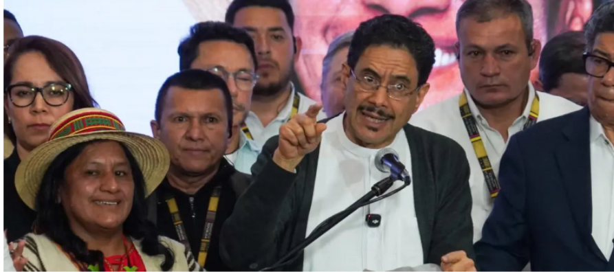
Iván Cepeda, candidato presidencial del Petrismo.

Elecciones 2026: cuántos colombianos terminarían definiendo al próximo presidente