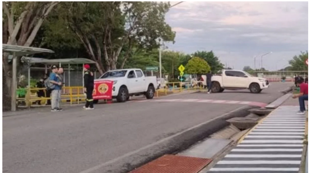
La USO declaró paro de 24 horas ante el no avance de la negociación de la convención colectiva

Ecopetrol informó que continúa participando en la negociación de la Convención Colectiva de Trabajo con la Unión Sindical Obrera (USO) y afirmó que mantiene su disposición para alcanzar acuerdos durante la etapa de arreglo directo.