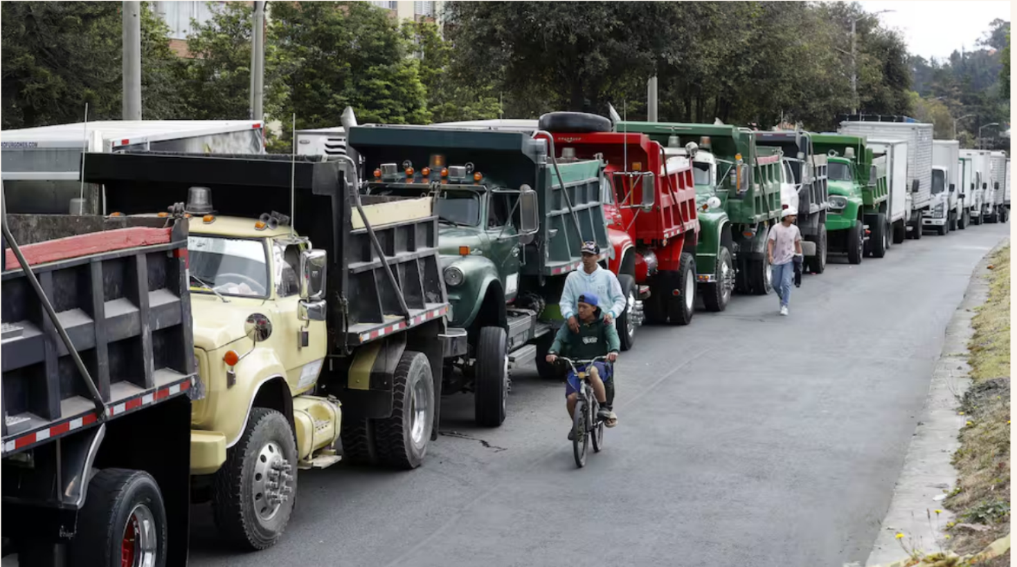
Paro en Ecopetrol : sindicato anuncia cese de actividades por 24 horas y movilizaciones en todo el país.

Clima. Se aproxima la tormenta del año con 24 horas de lluvias intensas y fuertes vientos: cuáles son las zonas más perjudicadas