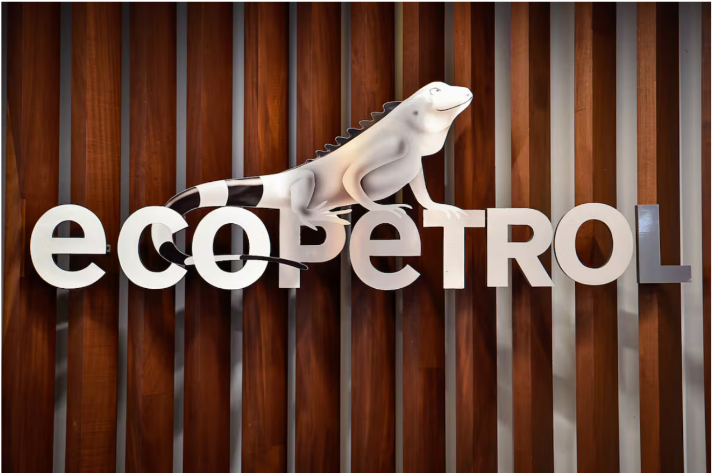
Imagen de referencia del logo de Ecopetrol .

Redacción Colombia 02 JUN 2026 - 10:07 AM