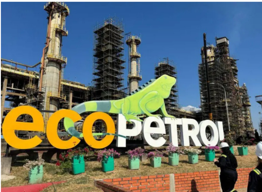
Ecopetrol es la única multilatina colombiana en el top diez del BID.

El BID revela qué 10 empresas latinas lideran la expansión regional. Ecopetrol es la única colombiana en el top diez. Así operan en 116 países.