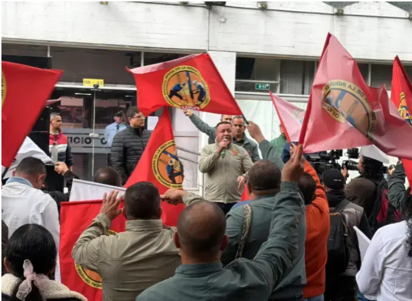
Ecopetrol aseguró que mantiene una disposición permanente al diálogo para continuar avanzando en la búsqueda de acuerdos durante la fase de negociación, que actualmente sigue activa.

La petrolera afirmó que mantiene abiertas las negociaciones con la USO y aseguró que garantizará el abastecimiento de combustibles y la continuidad de sus operaciones tras el paro de 24 horas convocado por el sindicato.