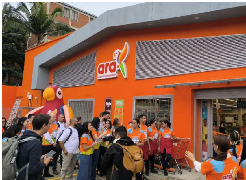
La SIC abrió investigación formal a Tiendas Ara por más de 2.000 quejas.