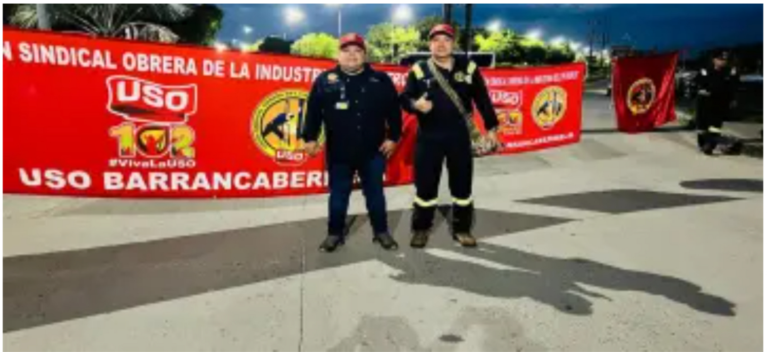
Blu Radio. Paro USO Barrancabermeja