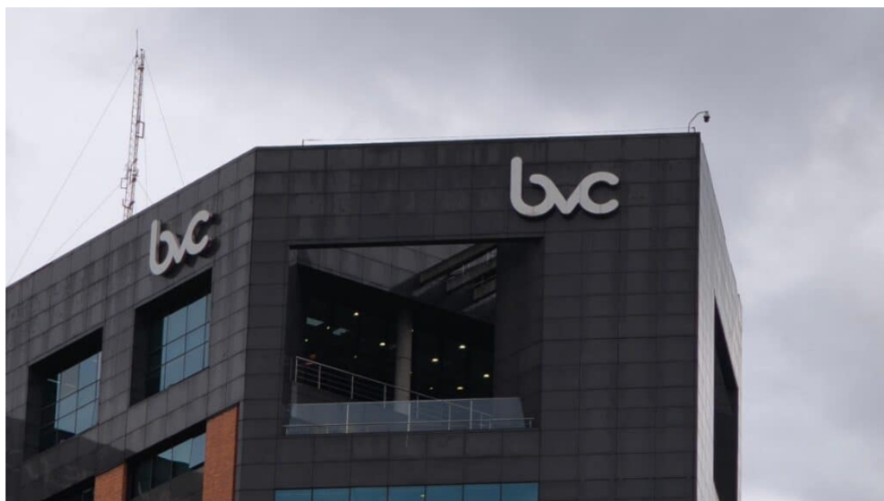
Sede de la Bolsa de Valores de Colombia.