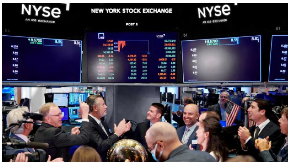
Bolsa de Nueva York.