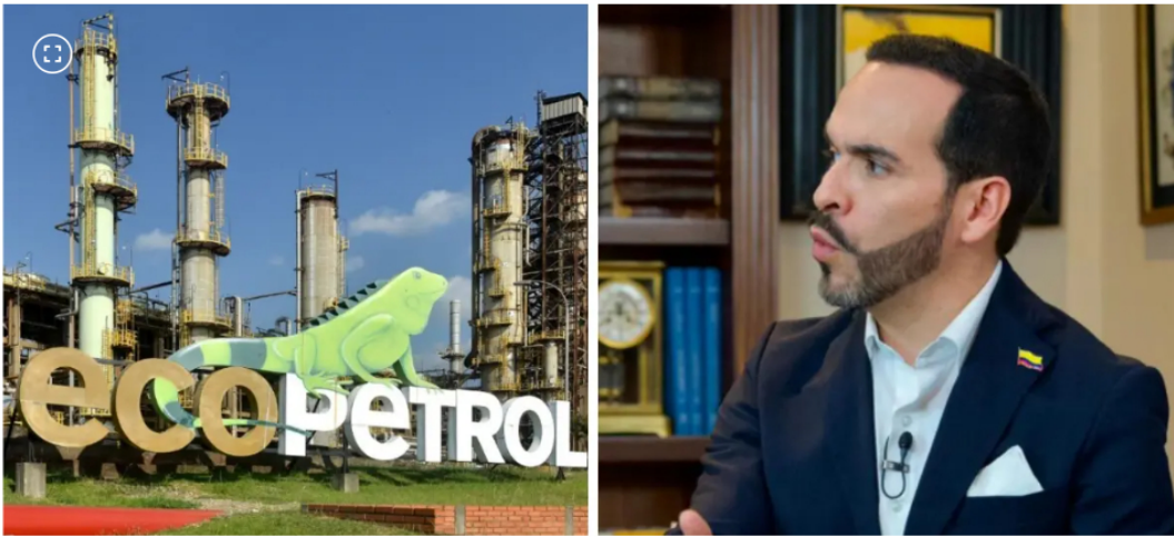
El resultado de las elecciones habría contribuido al alza de la acción de Ecopetrol.

La subida del petróleo en referencias Brent y WTI también contribuyó al alza de estos títulos.