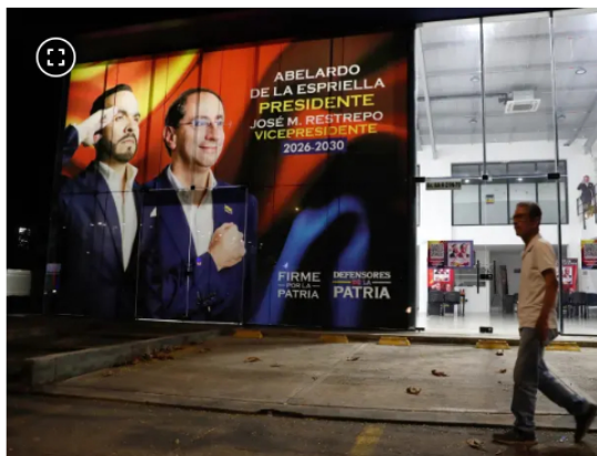
Abelardo de la Espriella, candidato presidencial.

La presidencia y la continuidad del proyecto político de la izquierda en el poder se definirá en tres semanas tras los resultados de las votaciones del 31 de mayo, pues ningún candidato obtuvo más del 50 por ciento de los votos.