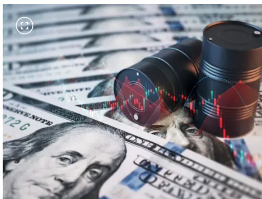
Precio del petróleo

Con el inicio de la semana, el precio del petróleo creció en sus dos referencias más importantes a nivel mundial: el Brent y el WTI. El precio del barril de petróleo Brent registró el lunes una subida del 4,9 por ciento, dejando su valor en 95,6 dólares.