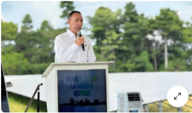
Ricardo Roa, presidente de Ecopetrol . Imagen: Ecopetrol

Puerto Bahía pertenece a Frontera Energy y sería el punto desde el cual Ecopetrol abriría una nueva infraestructura para la importación del energético. Fuentes del sector aseguraron que el proceso avanza mejor de lo esperado y que las proyecciones de demanda se mantienen positivas.