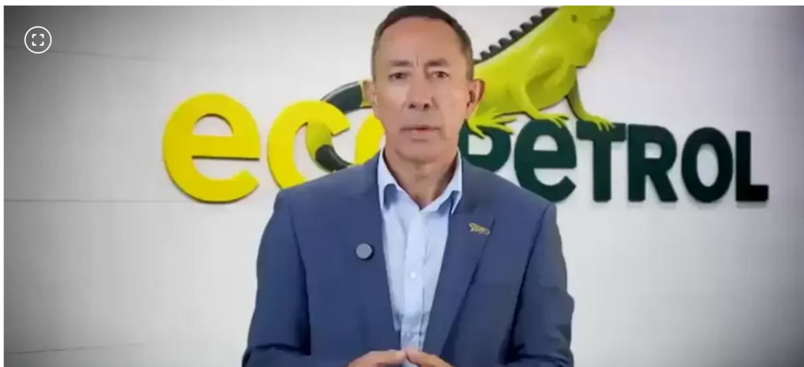
Ricardo Roa, presidente de Ecopetrol será imputado por la Fiscalía.

Se ha comentado mucho que el directivo dejaría el cargo ante imputaciones de la Fiscalía por dos presuntos delitos.