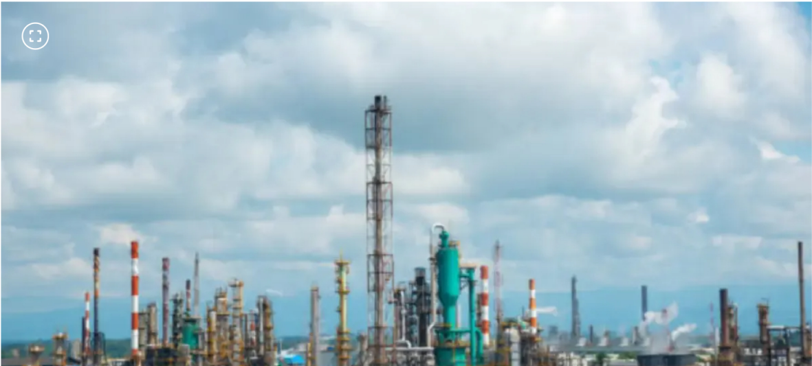
En 2025, Ecopetrol suscribió $23,8 billones en contratos para proyectos.

Según la compañía, esto representaría un incremento del 4,8% en comparación con lo reportado en 2024.