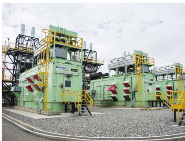
En 2025, Ecopetrol suscribió $23,8 billones en contratos para proyectos.

De esta cifra, el 96%, es decir $22,8 billones, corresponde a contratos con proveedores nacionales. Mientras que la contratación con empresas locales de las zonas donde Ecopetrol hace presencia fue de $5,7 billones en el 2025, frente a $5,5 billones en 2024.