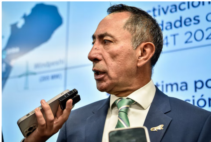
Infobae Colombia consultó con Ecopetrol sobre esta información, y desde la compañía indicaron que no existe ninguna información al respecto

De acuerdo con Caracol Radio , el análisis estará a cargo de firmas consultoras externas y analistas internos de Ecopetrol, quienes evaluarán y expondrán sus conclusiones sobre el alcance reputacional de estos hechos.