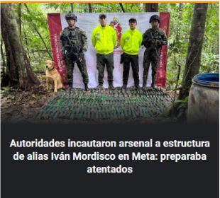
Autoridades incautaron arsenal a estructura de alias Iván Mordisco en Meta: preparaba atentados

Enfrentamientos entre Los Pachencas y las AGC deja más de 60 familias desplazadas en Ocaña: Defensoría del Pueblo exige respeto a los Derechos Humanos