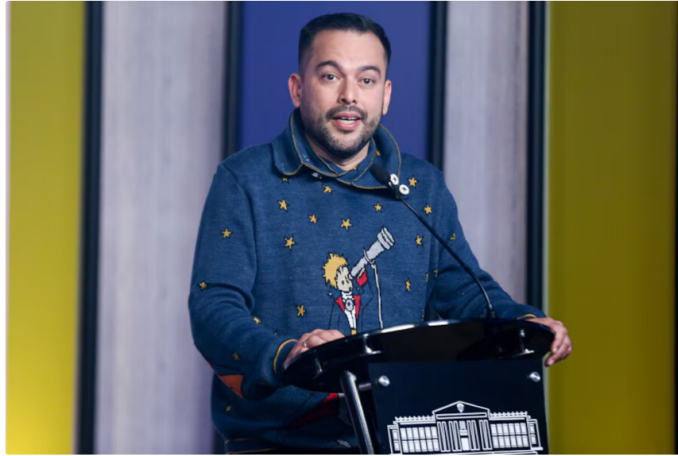
Edwin Palma, ministro de Minas y Energía de Colombia

de cae en Bogotá: Exijo que se entreguen los videos de seguridad"