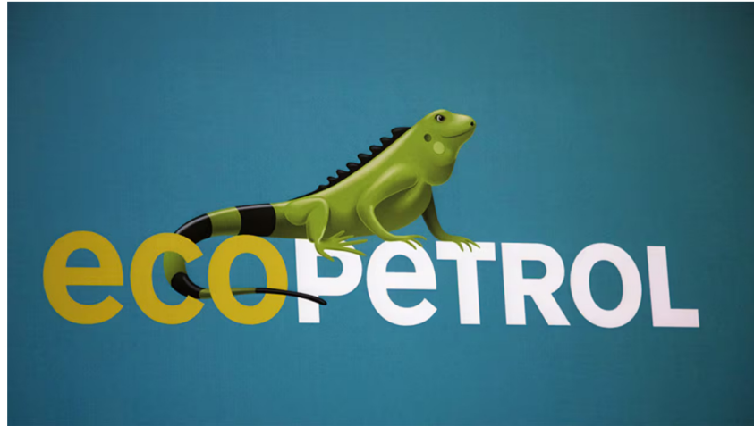
Contratos Ecopetrol