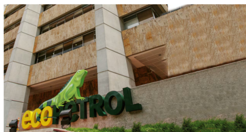
El 96 % de la contrataciones, es decir $22,8 billones, fue contratado con proveedores nacionales.

Después están las regionales de Orinoquía (Meta), por $1,01 billones (18 %); Piedemonte (Casanare y Arauca), por $600 mil millones (10 %), y Caribe (Bolívar, Atlántico, Córdoba, Sucre, Magdalena y La Guajira), por $520 mil millones (9 %). En Bogotá, la contratación de bienes y servicios llegó a $870 mil millones (15 %).