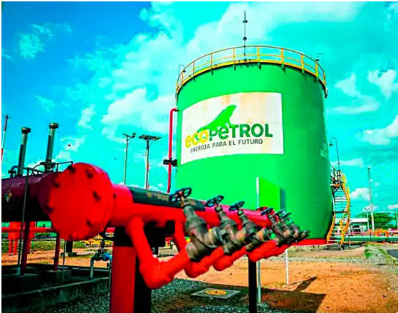
La compañía reportó crecimiento en contratación y mayor integración de proveedores regionales.

Durante el año suscribió bienes y servicios por $23,8 billones, de los cuales 96% correspondió a proveedores nacionales y $5,7 billones a empresarios locales.