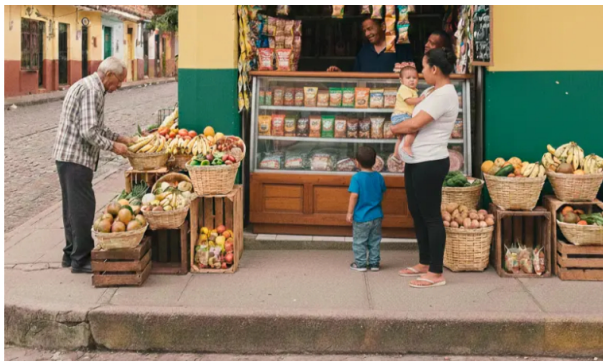
Servipunto considera que el desafío para las tiendas en 2026 es entender su nuevo rol.