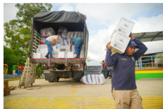
Helicóptero MI-17 de Hocol transporta provisiones esenciales a comunidades aisladas por inundaciones

La distribución de estas ayudas se concentra en Puerto Escondido, Canalete, Los Córdoba, Tierralta, Montería, Cereté y Lórica (Córdoba); Cartagena, Calamar, Montecristo y San Jacinto del Cauca (Bolívar); Riohacha, Manaure, Maicao y Uribia (La Guajira).