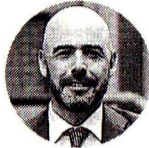
Jorge Bedoya Presidente de la Sociedad de Agricultores de Colombia

HACIENDA. LA PREVISIÓN DE LAS AGREMIACIONES MARCARÍA UN SEGUNDO AÑO DE REPUNTE DEL DATO, LUEGO DE HABER REGISTRADO 0,7% EN 2023 Y 1,6% EN 2024; LA PREVISIÓN MÁS ALTA ES DE 3,4%