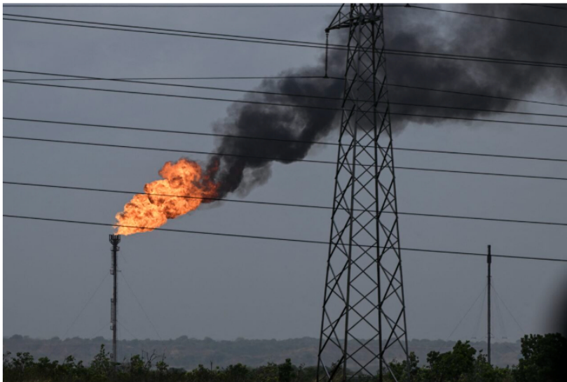
Nueva Delhi lleva años intentando recuperar más de 1.000 millones de dólares | Foto: Yuri Cortez / AFP

La reforma de la ley de hidrocarburos en Venezuela ha creado expectativas en Colombia sobre una posible participación de la petrolera estatal Ecopetrol en la reconstrucción del sector, pero la oportunidad para el país está en la importación de gas , afirma el experto Sergio Cabrales.