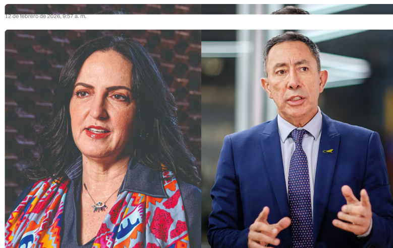
María Fernanda Cabal hizo la solicitud sobre el presidente de Ecopetrol, Ricardo Roa.

La senadora María Fernanda Cabal radicó formalmente una solicitud a la junta directiva de Ecopetrol para solicitar que evalúe la salida del presidente de la compañía, Ricardo Roa.