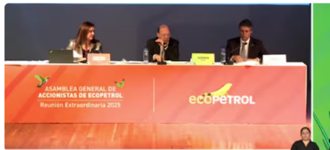
Recientemente, la asamblea de accionistas de Ecopetrol aprobó la entrada de un integrante de los trabajadores a la junta directiva de la petrolera.