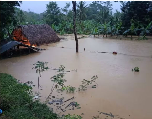
Las inundaciones afectan a la mayoría de los municipios del departamento (Fuente: archivo). Redes sociales

Petro, además, canceló su “participación en la Conferencia de Seguridad en Múnich-Alemania , debido a la emergencia que viven las y los colombianos en el norte del país por la situación inercial y la crisis climática ”, según confirmó en su cuenta de X. El mandatario añadió que su Gobierno continúa “atendiendo la emergencia en Córdoba”, uno de los departamentos más afectados que actualmente tiene a 24 de sus 30 municipios inundados y cerca de 53.000 familias damnificadas.