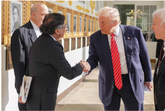
Venezuela fue uno de los temas en la reunión entre Petro y Trump a principios de febrero.

El presidente Gustavo Petro anunció que se comenzará a importar gas de Venezuela. "Vamos a traer gas venezolano muchísimo más barato" , expresó durante un acto de Gobierno en el municipio de Chaparral, en el departamento del Tolima . El Parlamento venezolano aprobó hace dos semanas una reforma a la ley de hidrocarburos que abre el sector a la inversión privada y extranjera, después de años de control estatal.