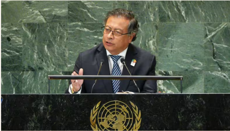
Petro canceló su viaje a Múnich y anunció que importará gas de Venezuela “mucho más barato”.

Alerta nacional: El Carmen decreta toque de queda y ley seca por amenazas de grupos armados en Norte de Santander