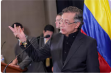
Gustavo Petro firmó el decreto ordenando el retiro de un general al que acusó de intentar sabotear su reunión con Donald Trump