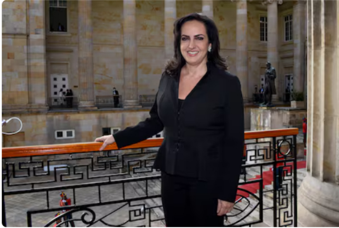
La senadora María Fernanda Cabal.