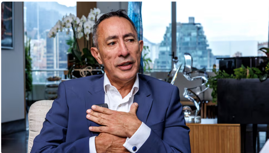
El presidente de Ecopetrol, Ricardo Roa

Si algo ha demostrado el presidente de Ecopetrol, Ricardo Roa, es su capacidad para sostenerse en el cargo pese a las adversidades y los escándalos que ha tenido que enfrentar durante su paso por la compañía petrolera más grande del país.