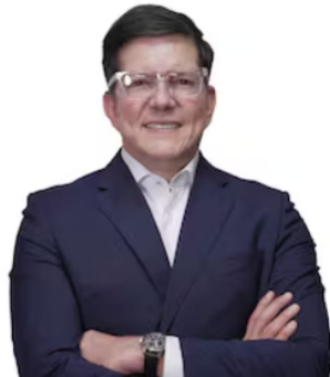
El candidato al Senado Wilson Ruiz.

Y siguió: “He hecho el compromiso honesto, transparente, tranquilo con la junta directiva cuando me entrevistaron, cuando me nombraron. La persona que les habla tiene claro que, si algún día llegara a verse impactada, afectada, el buen nombre, la reputación, el valor de la compañía en el mercado bursátil por estar presidiendo la compañía, voy a hacerme a un lado sin necesidad de que nadie me lo pida. Ni mi propia junta, ni el presidente ni el Congreso. Tengo la capacidad suficiente, soy transparente ”.