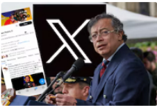
X tomó una sorpresiva decisión sobre un mensaje que publicó Gustavo Petro en su cuenta personal: “Advertencia”