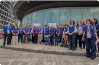
Lupa de la Unión Europea sobre las elecciones del 8 de marzo en Colombia: así avanza la misión en el país

Gustavo Petro Pacto histórico Ricardo Roa Ecopetrol