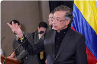
Gustavo Petro firmó el decreto ordenando el retiro de un general al que acusó de intentar sabotear su reunión con Donald Trump