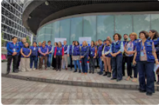
Lupa de la Unión Europea sobre las elecciones del 8 de marzo en Colombia: así avanza la misión en el país

Nación Política Dinero Mundo Deportes Tecnología Gente