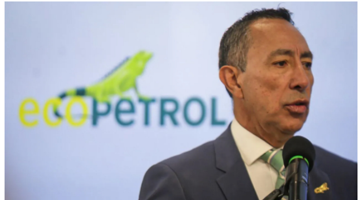
Ricardo Roa, presidente de Ecopetrol, es imputado por dos delitos

Recientemente, la Fiscalía anunció que imputaría cargos por dos delitos al presidente de Ecopetrol, Ricardo Roa. Ambos son el resultado de años de investigación por parte de las autoridades en el plano electoral y en el empresarial público. Al día siguiente, la Oficina de Control de Activos en el Extranjero (OFAC) de Estados Unidos emitió una medida que liberaliza las sanciones contra Venezuela en el mundo de los hidrocarburos. La respuesta del mercado a ambas noticias, sin embargo, muestra que por ahora Ecopetrol no recibe un impacto directo.