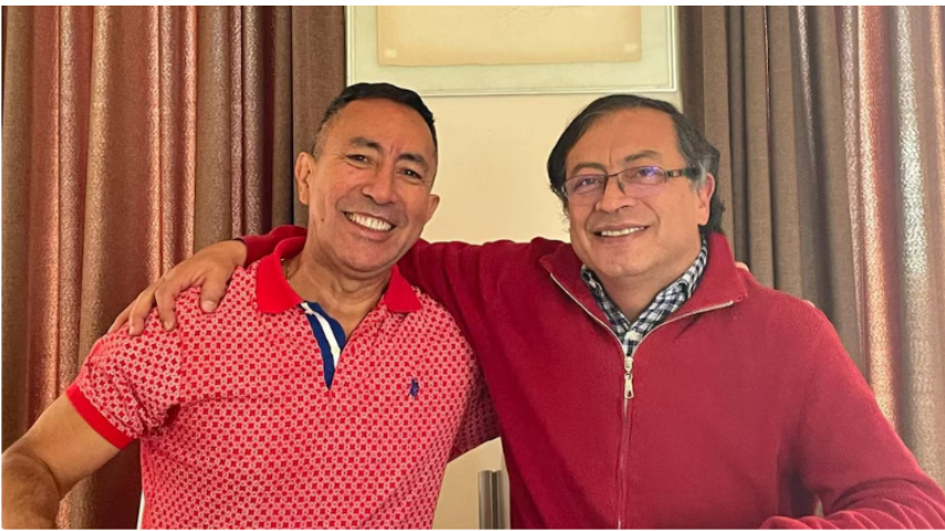
Ricardo Roa es cercano al presidente de la República, Gustavo Petro, que lo designó como titular de la estatal petrolera