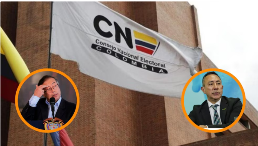
La campaña de Gustavo Petro superó los límites legales de gasto tanto en la primera como en la segunda vuelta, una conclusión a la que también llegó el CNE

Así pues, el abogado Pérez destacó que una democracia constitucional exige que el debate penal se resuelva en los estrados judiciales y no en los titulares . Para el organismo, la presión mediática puede generar una percepción de culpabilidad antes de que existan decisiones judiciales en firme, lo que afecta la legitimidad de la administración de justicia y los derechos fundamentales de Roa, que también tendrá que responder por el punible de tráfico de influencias.