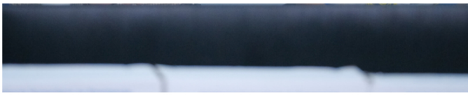
El presidente Gustavo Petro en el consejo de ministros en Córdoba.

Además, el sindicato insistió en que resulta indispensable realizar los pilotos de fracking , para que sean la ciencia y la técnica –y no el miedo– las que determinen su viabilidad.