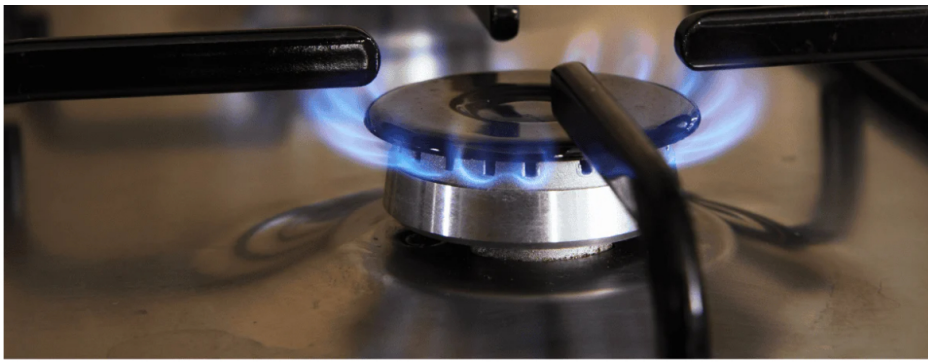
Gas natural.