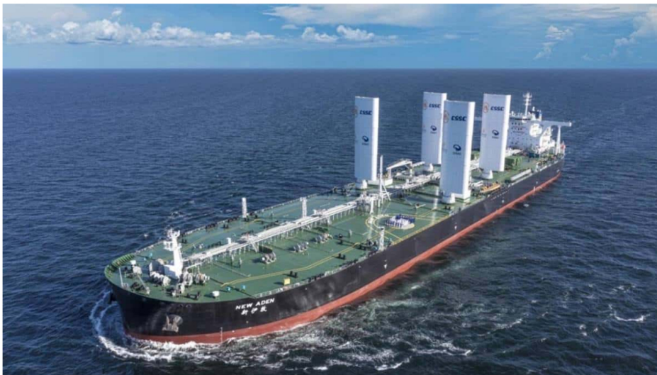
Importación de gas.

Por: Manuel Alejandro Correa - 2026-02-10