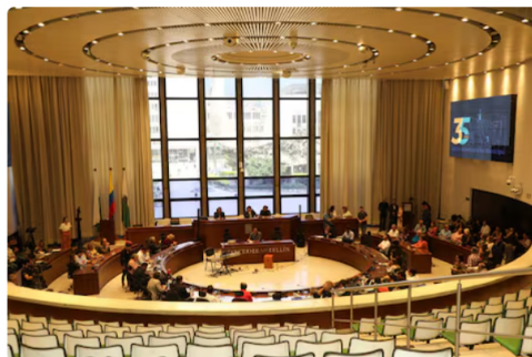
Los concejales de las comisiones primera y segundo adjuderon falta de garantías

en sus redes, pero le recordaron que era del Gobierno y así respondió: "Mostraré las fotos"