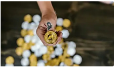
IC MARKETS Más información ¿Por Qué los CFDs de Criptomonedas Podrían Adaptarse a Su Cartera?