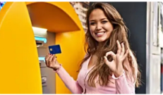
CFD LABS Más información Invertir $200 en Grupo Aval CFD podría devolverte un segundo salario