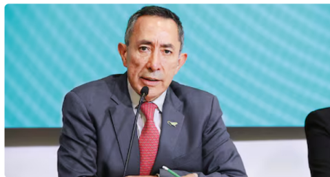
Ricardo roa Presidente de Ecopetrol

A su juicio, mantener en el cargo a un funcionario bajo cuestionamientos judiciales implica riesgos para el manejo de información , los sistemas de contratación y la relación con subordinados que eventualmente podrían ser testigos.