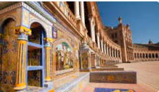
NACIONALIZATE.ES Más información Cómo lograr la Nacionalidad Española en 2026