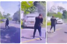
El ELN reconoció autoría en atentado en Arauca contra escoltas del senador Jairo Castellanos, pero dice que “no fue su objetivo”