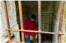
¿Por qué Gustavo Petro publicó una foto en una celda? La explicación del presidente llamó la atención en X