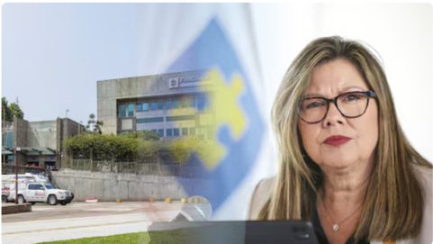
La gestión de la Fiscalía de Luz Adriana Camargo ha sido duramente cuestionada en casos importantes, como el juicio a Nicolás Petro y el saqueo a la UNGRD.

Desde esa perspectiva, el concejal sostiene que la suspensión del cargo no debería interpretarse como una sanción anticipada , sino como una medida preventiva orientada a garantizar la independencia de la investigación y la protección del interés público.