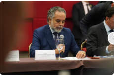
Armando Benedetti habló de la nueva emergencia económica: “Vamos a decir las cosas como son”