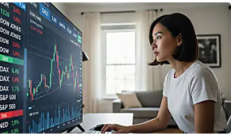
IC MARKETS Más información Los Índices Globales Están en Movimiento — ¡Es Hora de Operar!