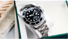
ROLEX SUBMARINER Compra ahora Deslumbra a todos los que te vean con este exclusivo reloj