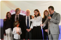
Miguel Uribe Londoño oficializa que será candidato presidencial con una fuerte arremetida contra el Centro Democrático