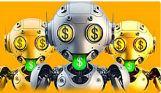
RADAR TECNOLÓGICO ¿Buscas nuevas opciones financieras? Conoce cómo la IA se aplica al trading co...