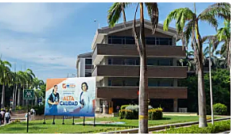
CON EDUCACIÓN BARRANQUILLA AVANZA PARA CONVEI Con educación Barranquilla avanza para convertirse en una ciudad inteligente. L...

Nación Política Dinero Mundo Deportes Tecnología Gente