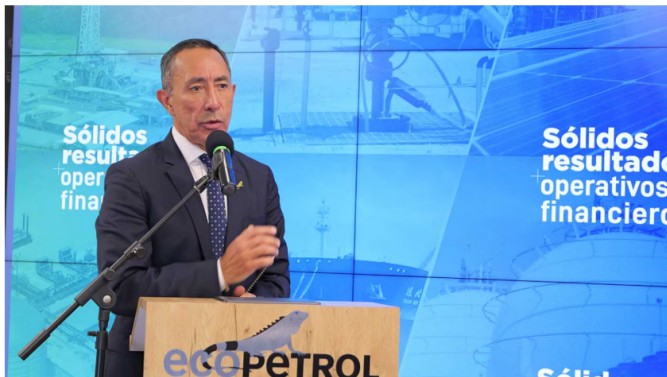
Presidente de Ecopetrol, Ricardo Roa.

El presidente de Ecopetrol enfrenta cargos por violación de topes en la campaña Petro y por tráfico de influencias para la compra de un apartamento.