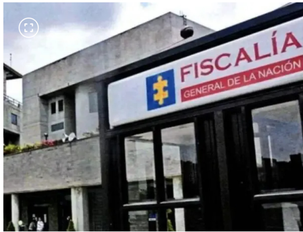
Fiscalía General de la Nación.

El pasado jueves, la Fiscalía anunció que imputará cargos al actual presidente de la petrolera estatal ante la presunta violación en la campaña electoral del actual jefe de Estado, Gustavo Petro .