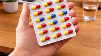
Furoma Esta pastilla olvidada limpia las venas a un ritmo impresionante