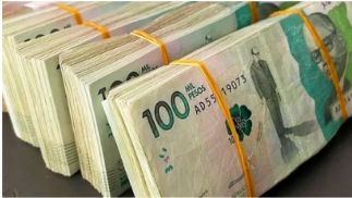
BTC Income Haz esto 15 minutos al día y gana 67 millones de pesos a la semana