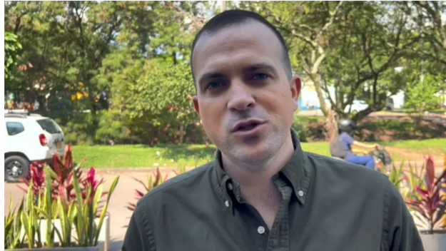
Imagen capturada de video