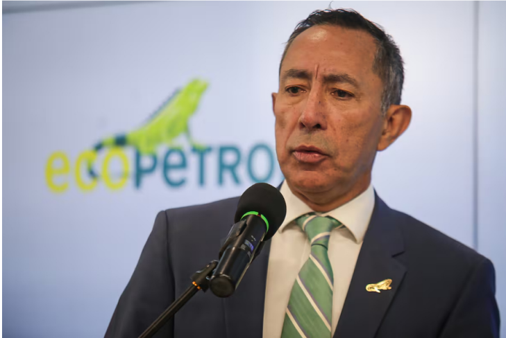
El presidente de Ecopetrol, Ricardo Roa Barragán.

Sobre la otra imputación que tiene pendiente, es decir, por violación de topes electorales en la campaña presidencial de Gustavo Petro, no se ha definido la fecha.