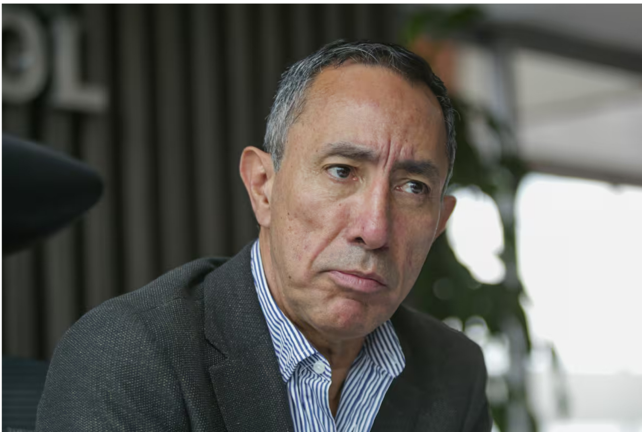
Ricardo Roa, presidente de Ecopetrol, investigado por presunto conflicto de intereses en millonaria compra inmobiliaria.

Siga las noticias de El Universal en Google Discover